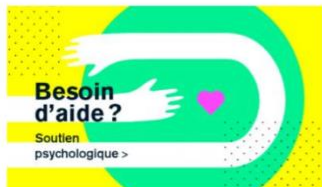
Ressources en santé globale