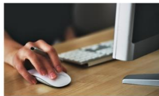
Centre de demandes RH