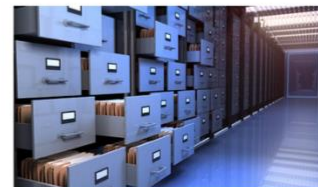
Dossier des membres du personnel : vers le numérique