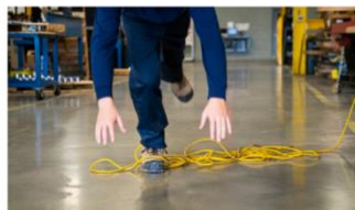
Formulaire de déclaration d'accident du travail