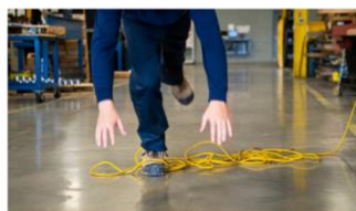
Formulaire de déclaration d'accident du travail