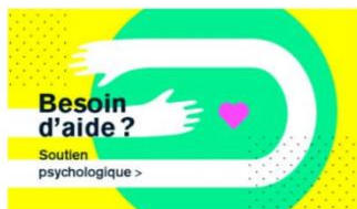
Ressources en santé globale